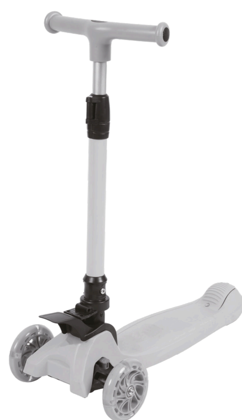
1. Трёхколесный самокат